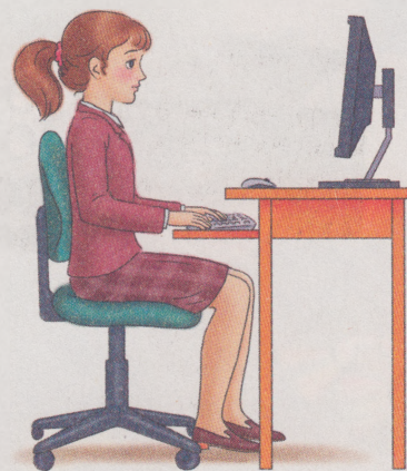
Мал. 1.1. Постава під час роботи з комп'ютером