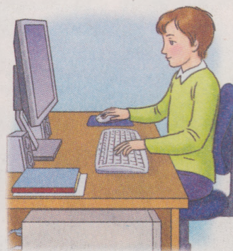
Мал. 1.3. Під час роботи з комп'ютером